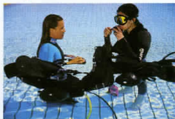
La plongée, une activité au programme des grands hôtels.

années, de 1967 à 1974, la dictature des Colonels. Finalement la Crète, premier empire maritime du monde il y a 4 000 ans, intègre la CEE en 1981, en qualité de province grecque et connaît depuis lors un développement économique permanent... Aujourd'hui, pour commencer notre voyage, nous choisissons l'hypothèse d'une arrivée à l'aéroport international d'Héraklion, suivie d'une location immédiate de 4x4 sur place, à l'agence Pop's car, par exemple. Dès les formalités de remise du véhicule accomplies, en route pour La Canée, via Réthymnon, par une autoroute en