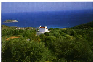
La ferveur religieuse a contribué à l'érection de chapelles sur toute l'île.

Héraklion, capitale de la Crète rebaptisée ironiquement «Infernaklion», vous comprendrez vite pourquoi, seule la visite du Musée d'archéologie sort du lot. Par ailleurs, selon les goûts, la vie nocturne du quartier branché de la ville, principalement fréquenté par sa jeunesse dorée, peut distraire. En revanche, deux visites sont incontournables dans la région d'Héraklion ; le site de Cnossos et le plateau de Lassithi. A 5 km de la ville, Cnossos constitue l'un des sites les plus visités de toute la Grèce certainement, davantage pour l'admirable puissance évocatrice de ses vestiges antiques, dont certains ont été opportunément reconstitués, que pour leur beauté intrinsèque ou la majesté du cadre. Quant au plateau du Lassithi, via le village de Mochos, c'est tout simplement notre paysage préféré de Crète. Un mélange harmonieux de crêtes enneigées, d'éoliennes élançées, d'arboriculture et de parterres élégamment fleuris. Un décor somptueux aux couleurs pastel que l'on aborde par de jolies petites routes,