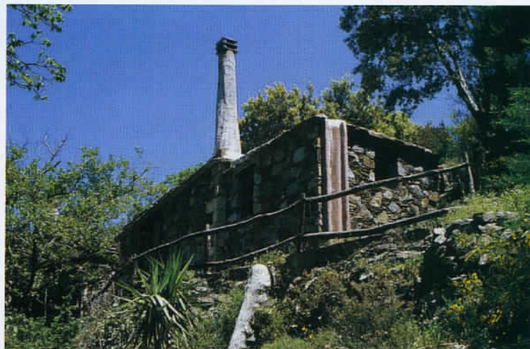
Reconstitution d'un village traditionnel crétois dans le centre de l'île où un restaurant de cuisine biologique propose ses spécialités.