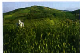
La majorité des Crétois est de religion orthodoxe.