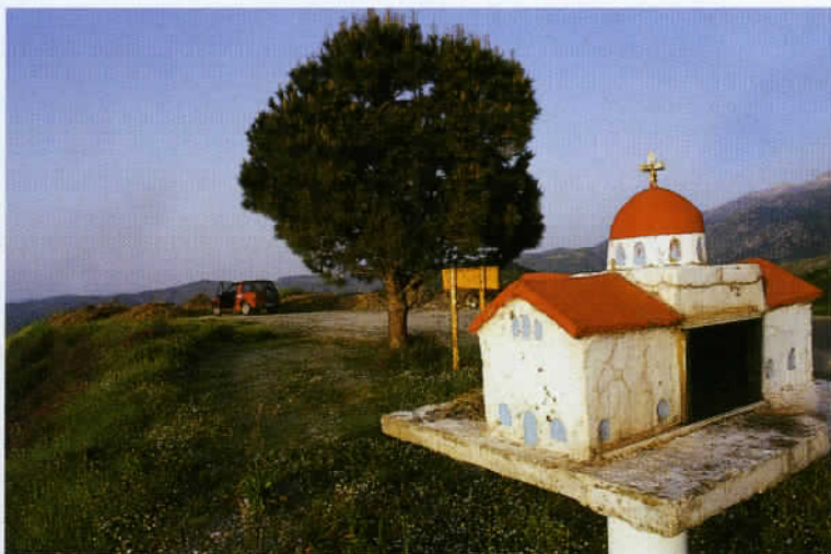
Ceux qui parcourent la Crète ne manqueront pas d'apercevoir de nombreuses chapelles miniatures, dont certaines rendent hommage aux victimes de la circulation.