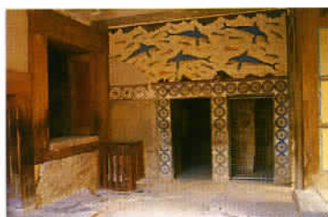
Une convaincante reconstitution de mosaïques à Cnossos.

Héraklion, capitale de la Crète rebaptisée ironiquement «Infernaklion», vous comprendrez vite pourquoi, seule la visite du Musée d'archéologie sort du lot. Par ailleurs, selon les goûts, la vie nocturne du quartier branché de la ville, principalement fréquenté par sa jeunesse dorée, peut distraire. En revanche, deux visites sont incontournables dans la région d'Héraklion ; le site de Cnossos et le plateau de Lassithi. A 5 km de la ville, Cnossos constitue l'un des sites les plus visités de toute la Grèce certainement, davantage pour l'admirable puissance évocatrice de ses vestiges antiques, dont certains ont été opportunément reconstitués, que pour leur beauté intrinsèque ou la majesté du cadre. Quant au plateau du Lassithi, via le village de Mochos, c'est tout simplement notre paysage préféré de Crète. Un mélange harmonieux de crêtes enneigées, d'éoliennes élançées, d'arboriculture et de parterres élégamment fleuris. Un décor somptueux aux couleurs pastel que l'on aborde par de jolies petites routes,