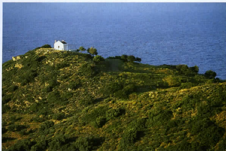
Une chapelle juchée dans les environs de Moklos, un petit village de pêcheurs. Un petit bout du monde adapté aux excursions en 4x4.