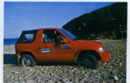
Le 4x4 prouve son utilité partout dans l'île.