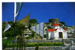
Une éolienne reconvertie en enseigne de restaurant.