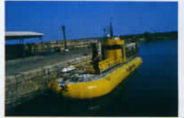
L'aquaboat permet d'admirer les fonds marins.