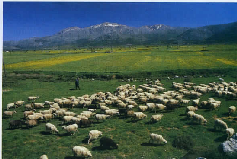
Le printemps est la période idéale pour se rendre en Crète, comme en témoigne la floraison sur le splendide plateau de Lassithi.