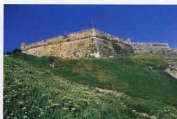
La ville de Réthymnon est gardée par la Fortezza, imposante forteresse vénitienne, et le port comporte de nombreuses tavernes aux terrasses agréables.

voici bientôt 150 ans : « Assis, je contemplais avec un plaisir et une admiration intenses, le jeu des couleurs roses, pourpres et dorées qui nimbait les sommets ou le paysage en dessous dans le jour déclinant... ». Une magie de la lumière qui n'a rien perdu de sa superbe au fil du temps. La seconde région que nous vous invitons à parcourir s'étale autour de Réthymnon, ville portuaire et commerçante dotée d'un réel pouvoir de séduction. Des cimes blanchies par des neiges éternelles, en arrière-plan de la Méditerranée et de façades turques ou vénitiennes