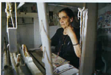
Le tissage, une activité artisanale traditionnelle toujours pratiquée.

voici bientôt 150 ans : « Assis, je contemplais avec un plaisir et une admiration intenses, le jeu des couleurs roses, pourpres et dorées qui nimbait les sommets ou le paysage en dessous dans le jour déclinant... ». Une magie de la lumière qui n'a rien perdu de sa superbe au fil du temps. La seconde région que nous vous invitons à parcourir s'étale autour de Réthymnon, ville portuaire et commerçante dotée d'un réel pouvoir de séduction. Des cimes blanchies par des neiges éternelles, en arrière-plan de la Méditerranée et de façades turques ou vénitiennes