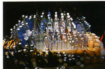
La boisson traditionnelle anisée de toute la Grèce : l'incontournable ouzo.