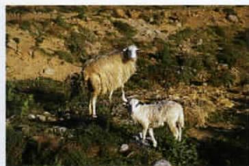
L'élevage caprin occupe une part importante de l'activité agricole.

de la nymphe Europe. A partir de 1 000 av.J.-C., La Crète est progressivement intégrée à la Grèce, avant de passer sous domination romaine, au début de l'ère chrétienne. Puis leur succèdent les Byzantins, les Arabes avant les Vénitiens, du XIII e au XVII e siècle. L'Empire ottoman s'installe en Crète dans la brutalité habituelle des occupants de 1669 à 1898, avant le rattachement à la Grèce en 1913. Plus tard, les Nazis bombardent massivement l'île à partir de 1941, l'envahissent et l'occupent, malgré l'intervention des Alliés, jusqu'en 1945. Ensuite, le pays subit pendant sept