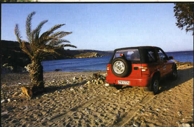
Au nord-ouest s'étire la célèbre plage de Vai nichée au cœur d'une baie et entourée d'une palmeraie emblématique.

Par Karim Belal, Photos Philippe Blanchot.