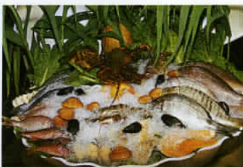
Le poisson, omniprésent dans le fameux régime alimentaire crétois.

de la nymphe Europe. A partir de 1 000 av.J.-C., La Crète est progressivement intégrée à la Grèce, avant de passer sous domination romaine, au début de l'ère chrétienne. Puis leur succèdent les Byzantins, les Arabes avant les Vénitiens, du XIII e au XVII e siècle. L'Empire ottoman s'installe en Crète dans la brutalité habituelle des occupants de 1669 à 1898, avant le rattachement à la Grèce en 1913. Plus tard, les Nazis bombardent massivement l'île à partir de 1941, l'envahissent et l'occupent, malgré l'intervention des Alliés, jusqu'en 1945. Ensuite, le pays subit pendant sept